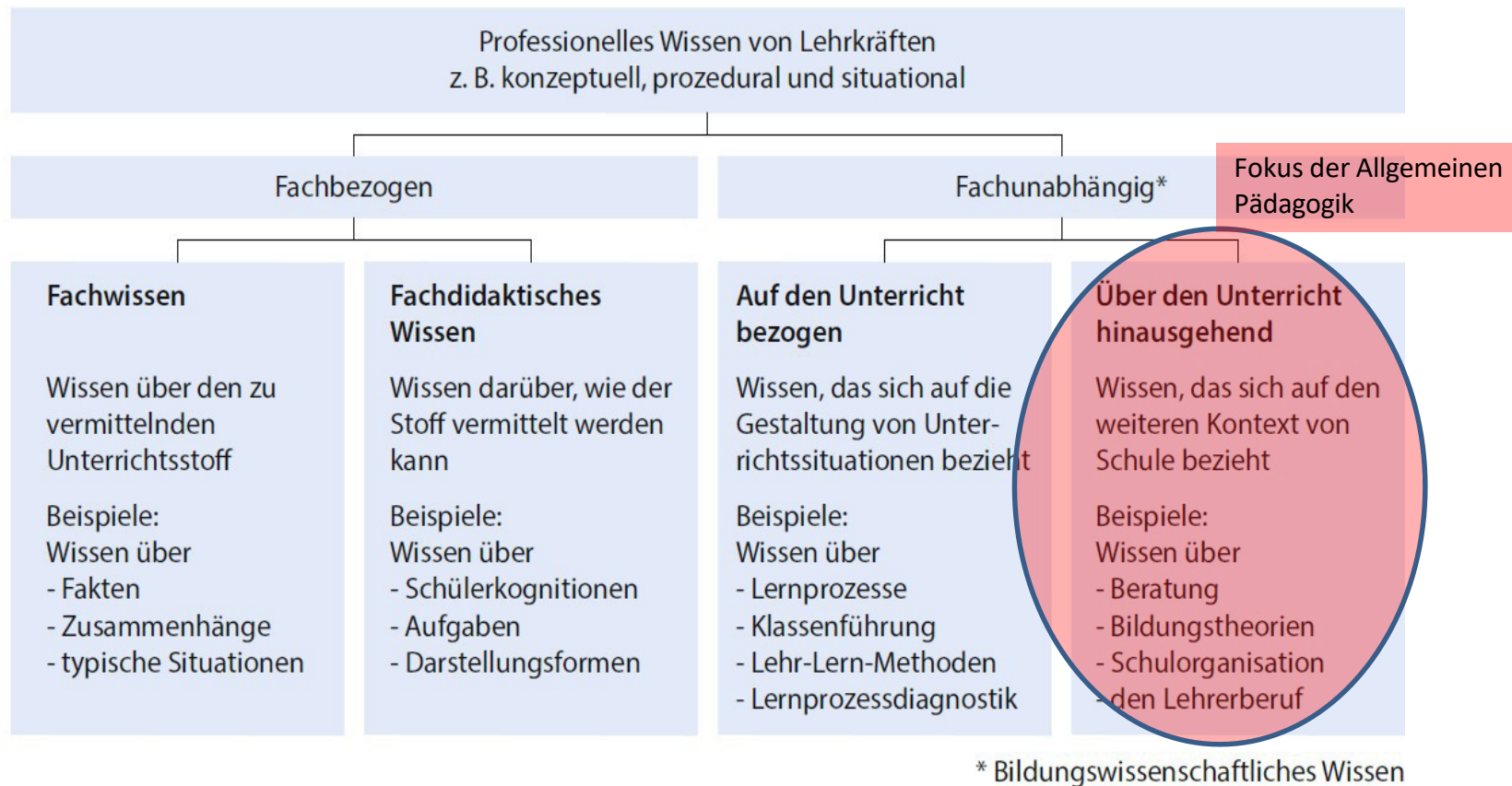
▣ Abb. 20.3 Fachbezogene und fachunabhängige Bereiche professionellen Wissens (* = bildungswissenschaftliches Wissen)