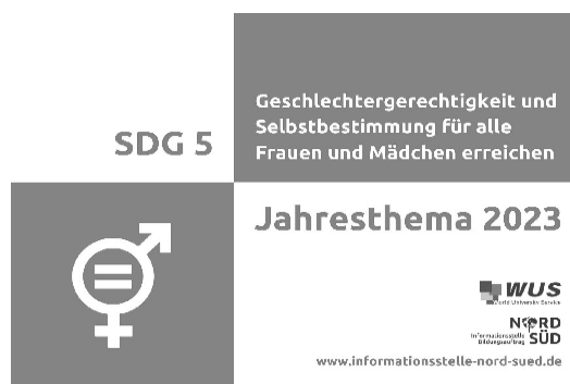
Abb. 1: Die Informationsstelle Bildungsauftrag Nord-Süd stellt entwicklungspolitisches Engagement zum Thema Geschlechtergerechtigkeit vor.

Informationsstelle Bildungsauftrag Nord-Süd & World University Service – Deutsches Komitee e. V. doi.org/10.31244/zep.2023.04.08