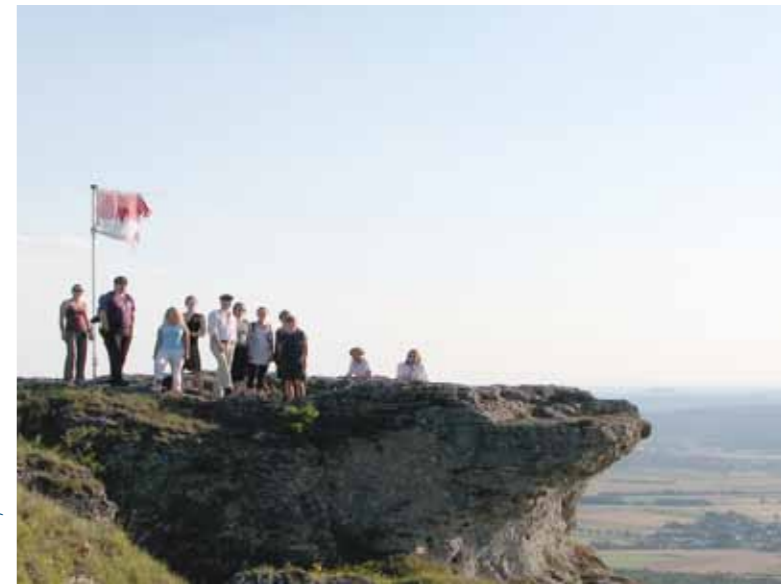
Titelbild: Carbon/Foto Pilarzyk; Matthias Rotter/AULA: Frank Bilda

Die Tandem-Reihe ist eine Gemeinschaftsinitiative von Otto-Friedrich-Universität Bamberg IHK für Oberfranken Bayreuth Handwerkskammer für Oberfranken