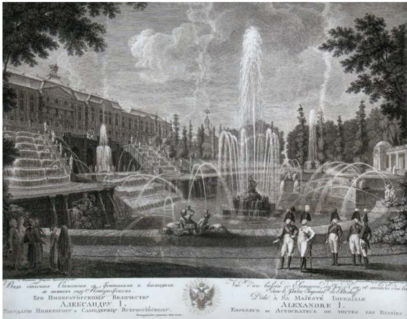
Ivan Českij nach einer Zeichnung von M. Šatošnikov: Ansicht des Unteren Parks von Peterhof. Ende der 1810er Jahre. Stich, Museumskomplex Peterhof.