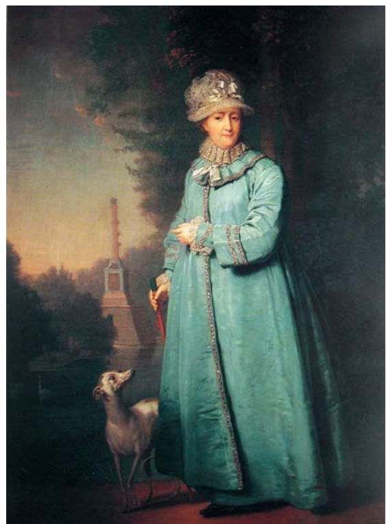
Vladimir Borovikovskij: Katharina II. auf dem Spaziergang in Carskoe Selo. 1794. Öl auf Leinwand, Moskau, Tret'jakov-Galerie

Die riesige Anlage von Carskoe Selo südlich von St. Petersburg verkörpert den Geist des russischen Absolutismus im Wandel von barocken zu klassizistischen und sentimentalistischen Vorstellungen. Ihre heutige Gestalt erhielt sie in der zweiten Hälfte des 18. Jahrhunderts. Unter Kaiserin Elisabeth wurden die vorhandenen Bauten ab 1752 unter der Leitung von Francesco Bartolomeo Rastrelli zu einem über dreihundert Meter langen Schlosskomplex erweitert, mit einer barocken Fassade versehen und durch eine aus Oberem und Unterem Garten bestehende reguläre Parkanlage in den umgebenden Raum integriert. Das gesamte Koordinatensystem zwischen dem Cour d'honneur und der Menagerie schloss auf der Gartenseite Pavillons wie die Eremitage, die Grotte am Ufer des großen Sees und eine nicht erhaltene Rutschbahn ein. Der vierteilige Obere Garten wurde mit allegorischen Skulpturen bestückt und erhielt ein Heckentheater, einen Berg Parnass und einen von Broderien gesäumten Essplatz.