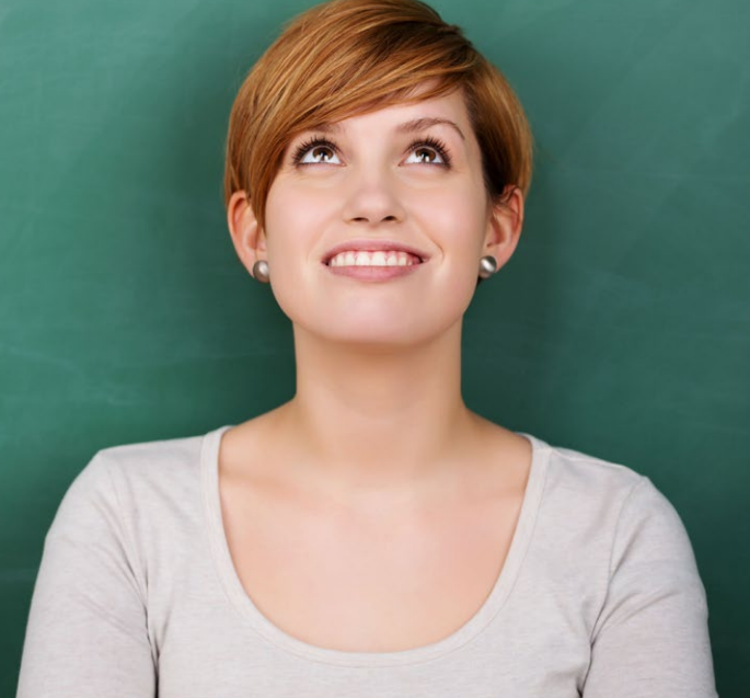
Stand: 11./2017 – Fotos: Universitäts Bamberg, Titelbild contrastwerkstatt/stock.adobe.com