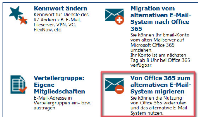
Abbildung 3: Auswahl „Von Office 365 zum alternativen E-Mail-System migrieren“

Klicken Sie nun auf Von Office 365 zum alternativen E-Mail-System migrieren .