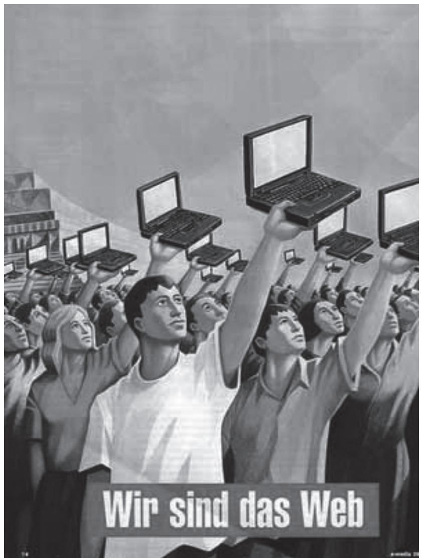
Abb. 1: Web 2.0 als gesellschaftsutopischer Traum? (E-media Nr. 26A, Januar 2006, http://www.news.at/emedial )

Denn Bürger/-innen spielen eine aktive Rolle im Prozess der Recherche, des Berichts, des Analysierens sowie des Verbreitens von Nachrichten und Informationen (vgl. Bowman/Willis 2003). Mit dieser Partizipation soll die Bereitstellung von unabhängigen und relevanten Informationen erreicht werden, die eine Demokratie benötigt (vgl. Gillmor 2004). Da im Kontext von Meinungsbildungsprozessen Kommunikation in Demokratien zu großen Teilen öffentlich und mittels Medien stattfindet, berührt dieser Tätigkeitsbereich einen Schlüsselbereich im System funktionierender Demokratie. Wenn Pressefreiheit nicht als Privileg für Medienkonzerne verstanden werden soll, bedarf es Bemühungen, eine breitere Beteiligung zu erreichen. Die Vorstellung, dass das Brecht'sche Radiotheorem in der Ausbreitung und Weiterentwicklung seine Realisierung erfährt, sorgt dabei für großes Interesse in Kommunikations- und Gesellschaftswissenschaften. Führt das Web 2.0 also zur politischen Partizipation 2.0? Die neuen Chancen für politisch bzw. gesellschaftlich Aktive scheinen offensichtlich. Die technischen Möglichkeiten müssen aber erst in den Griff bekommen werden und dann vor allem mit Praktiken politischen Engagements verbunden werden. Die Qualifizierung der politisch Aktiven im Hinblick auf die Medienkompetenz und die Motivierung der Internetnutzer zu politischer Teilhabe hin zu einer breiten basisdemokratischen Beteiligungskultur stehen allerdings vor großen Herausforderungen.