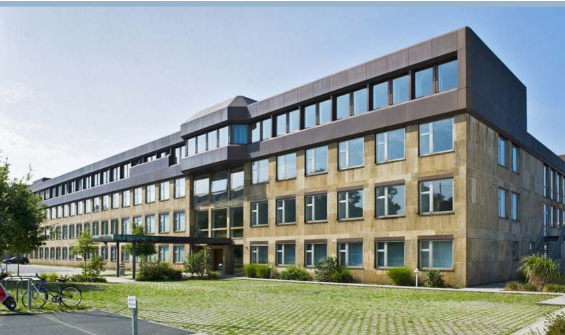
Universität Feldkirchenstraße