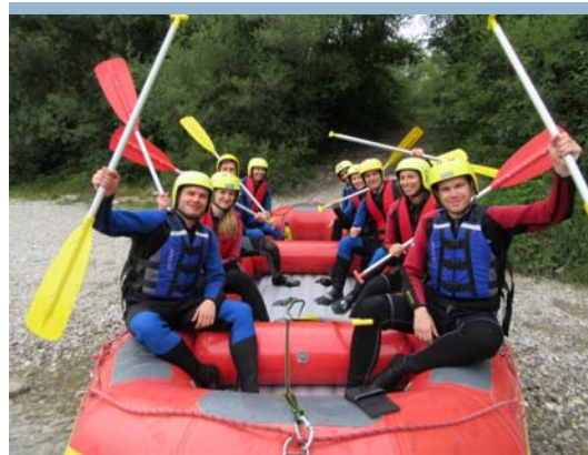
So sieht Motivation aus...