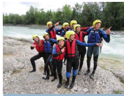
Volle Kraft voraus...

Am 31. Juli 2016 fand unser alljährlicher Lehrstuhl Ausflug statt und auch diesmal haben wir keine sportliche Herausforderung gescheut. So ging es zum Rafting nach Bad Tölz, mit dem Veranstalter „Wilde Kaiser“ bezwang das IRWP-Team unter anderem den so genannten „kleinen Isar-Katarakt“ auf der Einsteigertour von Lenggries nach Bad Tölz gleich mehrmals. Auch wenn es sich manchmal nicht so angefühlt hat, haben alle diesen feuchtföhlichen Ausflug heil überstanden und beim abendlichen Wirtshausbesuch waren alle Strapazen vergessen – mal schauen, wo es nächstes Jahr hingeht...