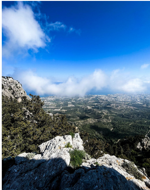
Ausblick von der Burg St. Hilarion

An bewölkten Tagen verschwinden die jahrhundertealten Gemäuer von St. Hilarion zwischen den Wolken. Der Aufstieg hat sich gelohnt - fast die gesamte Nordküste der Insel, weite Teile des Landesinneren und das Mittelmeer sind von dort zu sehen. Beim Gang durch die Mauern der Kreuzfahrerburg wird den Studierenden einmal mehr bewusst, welche Geschichte und Faszination Zypern mit sich bringt.