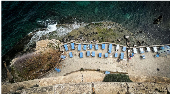
Die Mittelmeer-Küste von Zypern