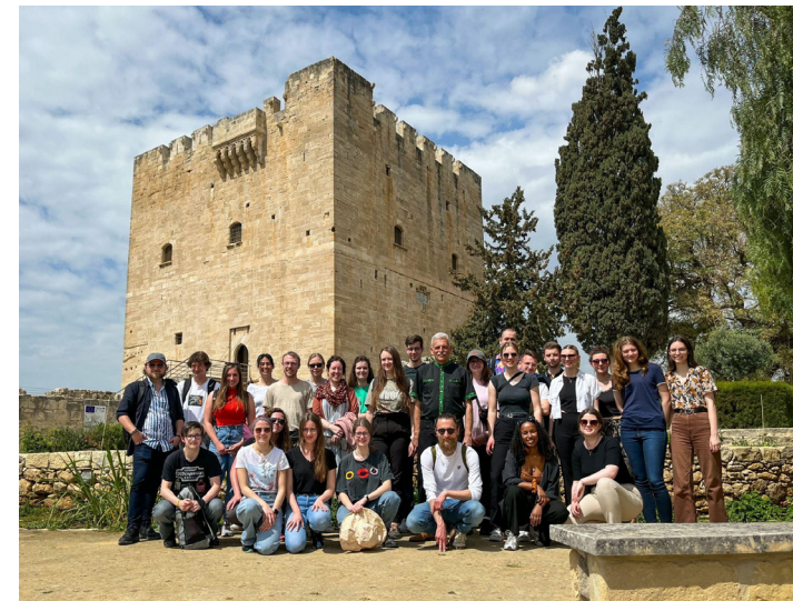
Exkursions-Teilnehmende vor der Burg Kolossi in der Nähe von Limassol